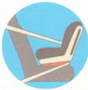
Лицом против движения