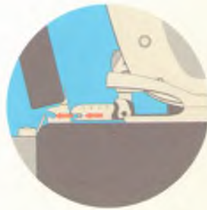
Лицом против движения (ISOFIX)