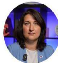
ВАЛЕНТИНА КУЛЬБИЦКАЯ, председатель Общероссийской общественной детско-юношеской организации по пропаганде безопасности дорожного движения ЮИД